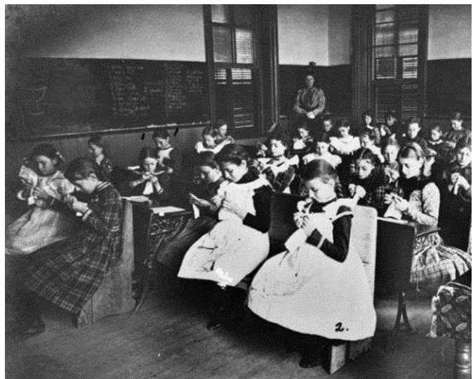
Niñas en una clase de costura, escuela en inglés-alemán, San Antonio, c. 1895

Pero para los 1900s la emigración alemana disminuyó. Después, dos guerras mundiales llevaron la emigración a su fin, excepto por la migración a las ciudades después de la guerra. Los prejuicios generados por las guerras mundiales también afectó el uso del alemán hablado en Texas, incluyendo publicaciones en alemán. Causas más generales—como la despoblación de áreas rurales y la prohibición de los matrimonios interraciales— redujeron la prominencia alemana.