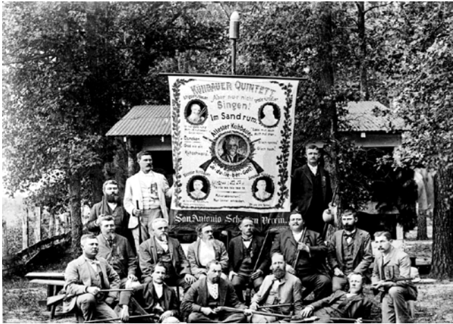
Club de tiro llamado San Antonio Schützenverein, c. 1890

Muchos de los colonizadores alemanes se establecieron en el norte y oeste del condado de Austin. Por consiguiente, un “cinturón alemán” fue creado, extendiéndose desde la planicie costera hasta las colinas de Texas, incluyendo los pueblos grandes de New Braunfels y Fredericksburg.