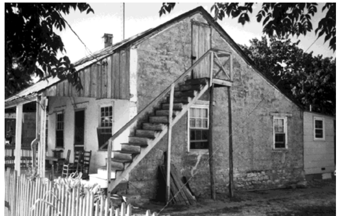
Una casa de los domingos en Fredericksburg

Los colonizadores eran, típicamente, pequeños grupos de familias que vivían cerca en Europa y que se establecieron de nuevo, como pequeños grupos viviendo juntos en Texas. La mayoría de los que llegaban se instalaban como granjeros, los primeros cerca de Friedrich Ernst en lugares tales como Industry, Cat Spring y Rockhouse.