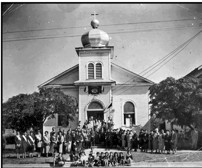
Iglesia Ortodoxa Siria de San Miguel, Beaumont, c. 1936

En San Antonio muchas familias son maronitas, un rito oriental de la Iglesia Católica en el que la misa se lleva a cabo en parte en siríaco y arameo. La iglesia sigue siendo el centro comunitario y el espíritu del grupo es lo suficientemente fuerte como para apoyar eventos periódicos especiales durante el año con música árabe, baile y comida.