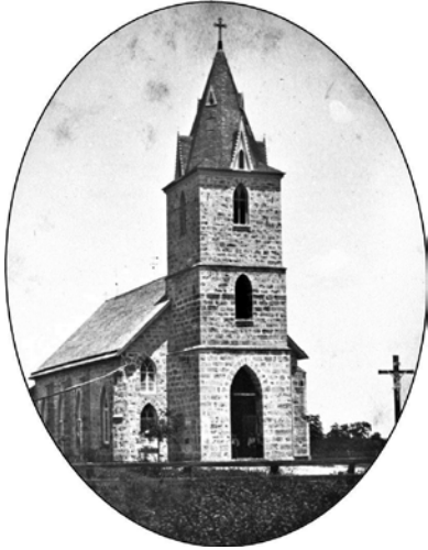
Iglesia de la Inmaculada Concepción de la Sagrada Virgen María, Panna Maria

Los tejanos polacos han sido por muchos años uno de los grupos étnicos más aislados, preservadores de tradiciones, conservadores, y rurales del estado.