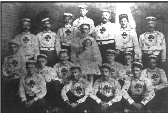
La unidad de bomberos de la Shamrock Hose Company para el pueblo irlandés en Corpus Christi.